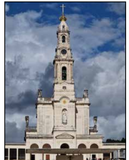
Fatima octobre 2024

Bonne et Heureuse Année 2025 à chacune et chacun.