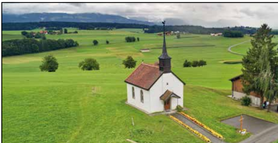
Magnifique vue de la chapelle de Mossel