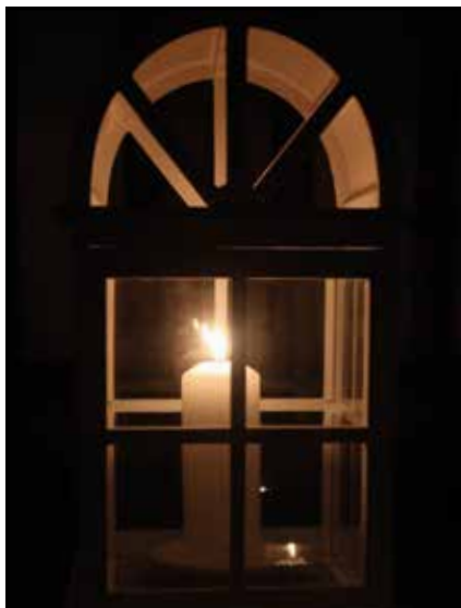
Lumière de la Paix, venue de Bethléem

N'oubliez donc pas de vous munir d'une lanterne, d'un bocal, sans oublier la bougie bien sûr si vous désirez l'accueillir chez vous durant les fêtes.