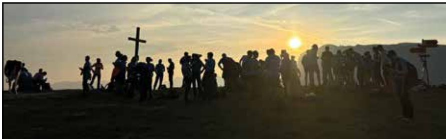
Lever de soleil, promesse d'un jour nouveau