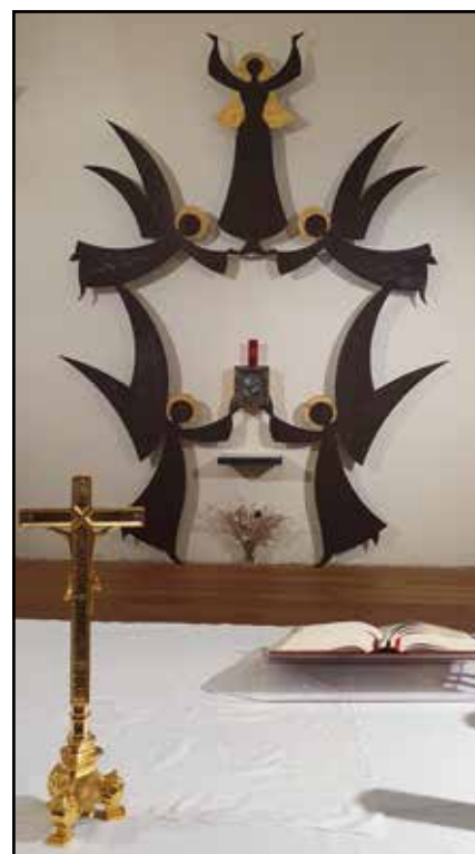
Chœur de l'église de Vallorcine

Le Chanoine Jean-Pierre Liaudat est heureux de partager un moment convivial entre ses paroissiens et les Châtelois qui eux retrouvent un contemporain ou un ancien élève. Un grand merci à lui pour son invitation dans une des paroisses qu'il dessert. Merci à la paroisse de Vallorcine pour son accueil et la liaison offerte à tous les membres de la Cécilienne pour rejoindre le barrage par le Verticalp-Emosson. Un funiculaire, un petit train à flanc le coteau et le mini-funic et ses deux cabines emmènent tout le monde vers le lac d'Emosson et le restaurant panoramique.