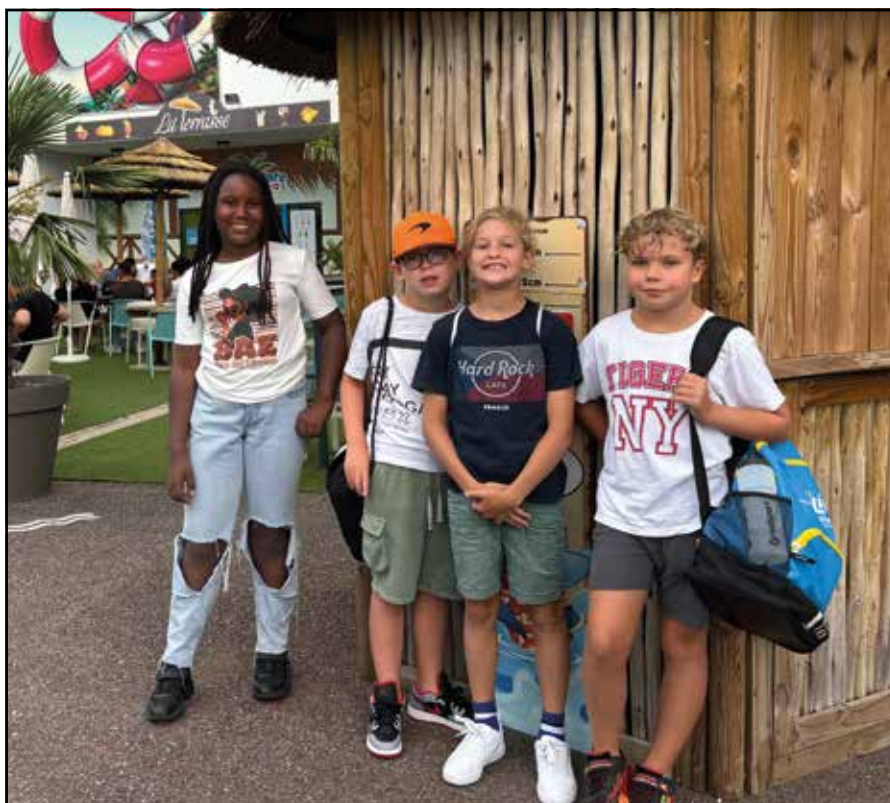
Sortie des servants de messe 2024