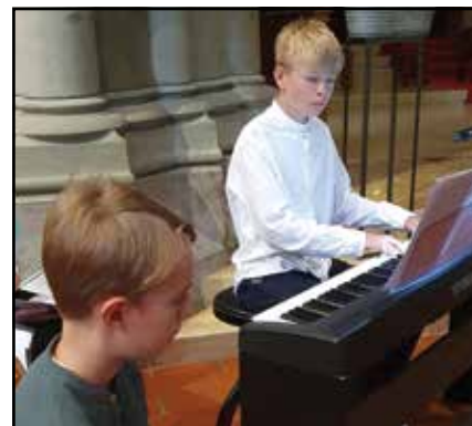
Messe en familles, 22.09.2024