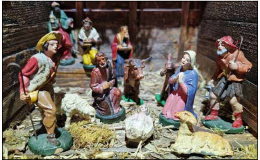
Crèche achetée en 1946, au sortir de la 2 ème guerre mondiale, hauteur des personnages max. 10cm