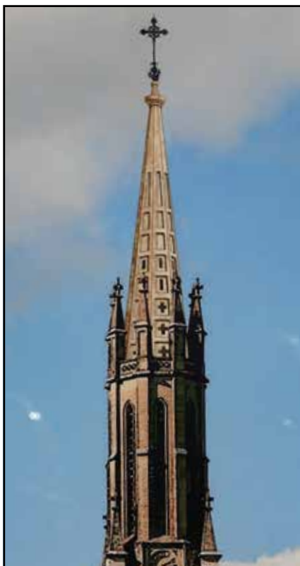
Maquette en trompe-l'œil de la flèche