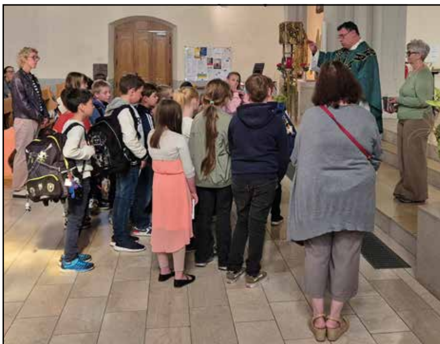
Bénédictio des cartables

À partir de 23H30, notre chœur mixte paroissial chantera pendant une demi-heure toute une liste de chants de Noël avant le début de la célébration. N'hésitez pas venir écouter ces belles chansons.