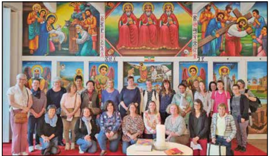
Les catéchistes sont heureuses de transmettre la foi aux enfants

Le retour s'est déroulé dans la gratitude pour ces beaux moments vécus et les catéchistes remercient les paroisses qui en ont permis la réalisation.