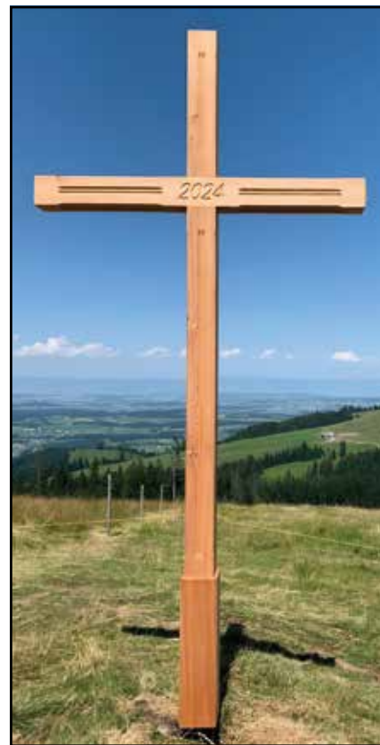
Croix de La Goille aux Cerfs

J'ai même installé une table et des bancs pour que les gens puissent pique-niquer et se ressourcer un moment près de cette croix », explique Florian. Cette initiative démontre son