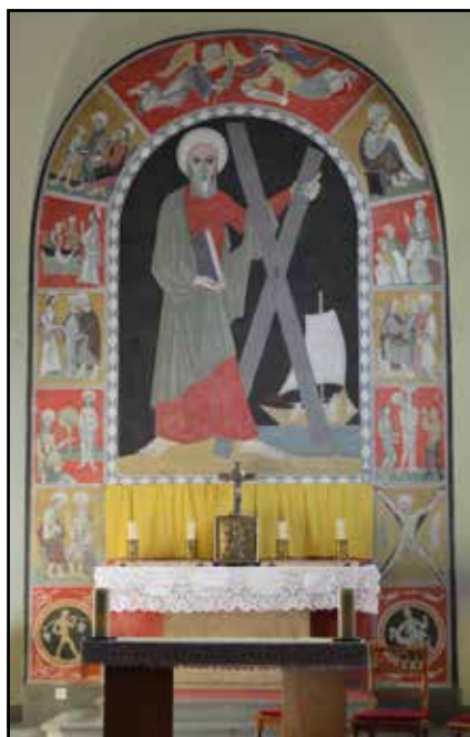
Chapelle de Bossonnens

Nous vous invitons à faire le déplacement à Granges et/ou à Bossonnens pour fêter les différents patrons de ces chapelles et aller à la rencontre des paroissiennes et des paroissiens qui font habituellement le déplacement dans notre église paroissiale.