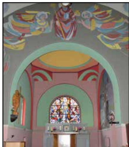
Chapelle de Granges

Avec le mois de janvier, arrive la Patronale de Bossonnens qui se déroulera en la chapelle le dimanche 19 janvier 2025 à 10H30.