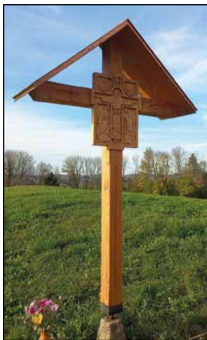
Croix de Monterban

N'hésitez pas à venir la découvrir lors d'une promenade dans notre paroisse.