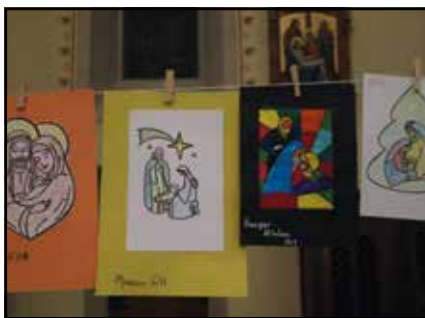
Messe de Noël en familles, Attalens 24.12.2023