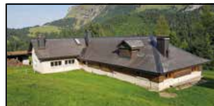
Chalet du Châh, Rathvel