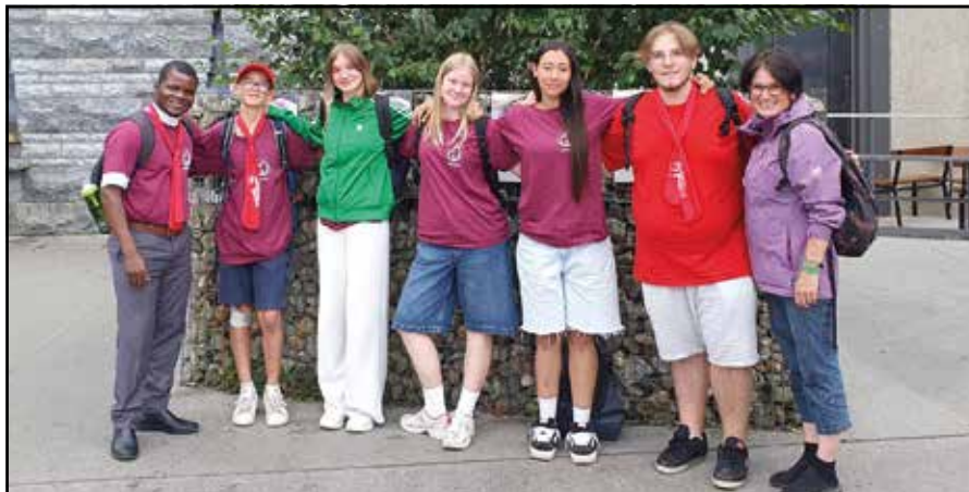
Ils rayonnent de la joie de Lourdes

Je suis content d'avoir participé à ce pèlerinage qui m'a beaucoup plu. J'ai trouvé que le sanctuaire était un endroit inoubliable et j'ai beaucoup aimé avoir des contacts avec les malades et pouvoir tirer leur chariot. Je suis aussi très content d'avoir participé à la messe à la grotte. Merci aux organisateurs.