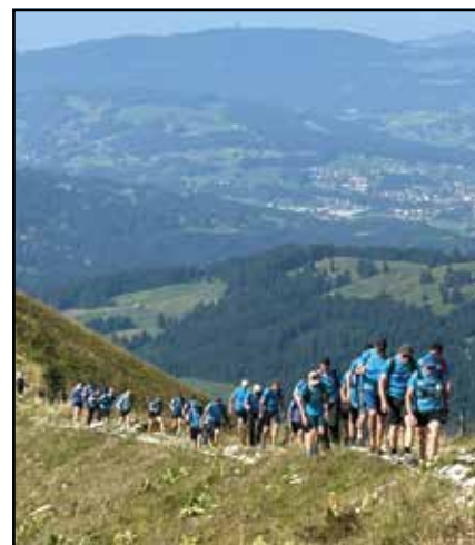
Bientôt le sommet du Molésion

Gageons que, durant cette nuit du 30 au 31 août 2024, plein de petites étoiles ont souri en voyant des chenilles lumineuses gravir la montagne. Bravo et merci à tous ceux qui rendent possible cette belle odyssee, à tous les bénévoles qui assurent l'organisation et à tous ceux qui s'inquiètent du ravitaillement des participants. Bravo aux marcheurs pour leur belle solidarité et leur endurance.