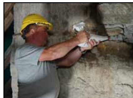
Les maçons en pleine action de jointage

de nous montrer son travail, sous le regard admiratif de sa maman.