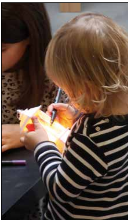
Messe en familles 05.11.2023