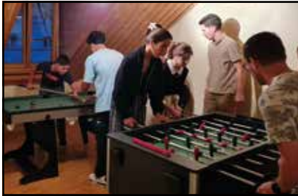
Texte et photo BÉNÉDICTE JAGGI

Tu es jeune, tu te poses des questions sur le monde dans lequel tu vis, ou tu veux vivre un moment entre amis, rejoins-nous! Le groupe ThéoApéro est fait pour toi.