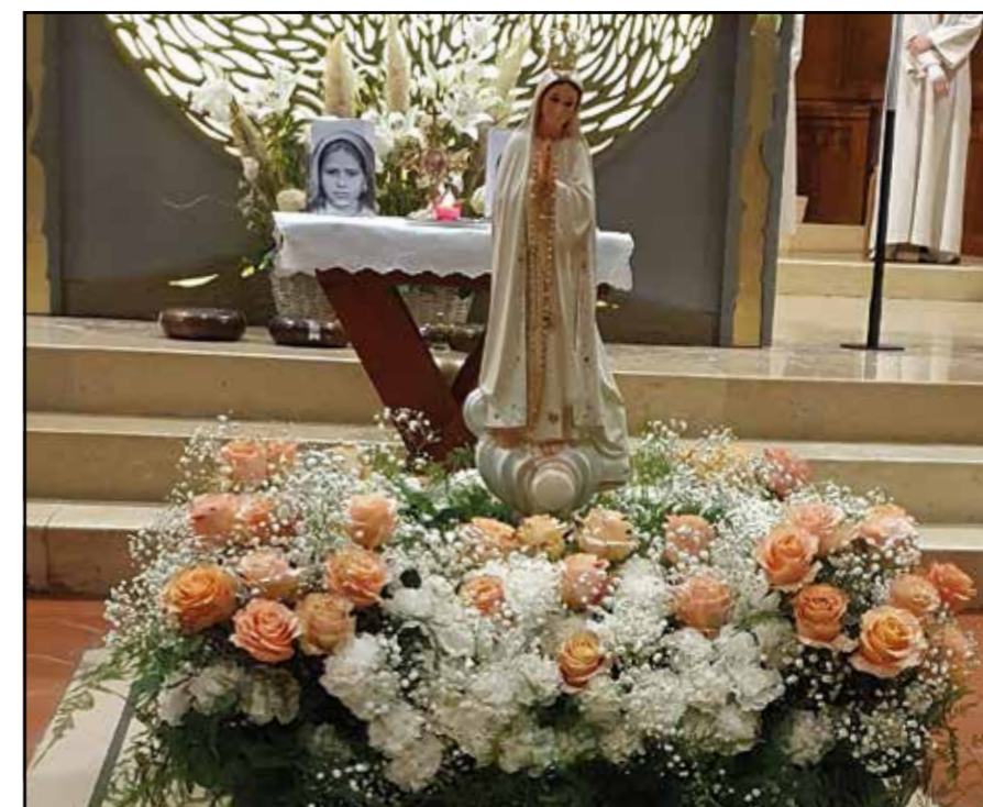
Notre Dame de Fatima toujours magnifiquement fleurie

Merci à la Communauté portugaise de nous permettre de vivre cette proximité avec Notre-Dame de Fatima.