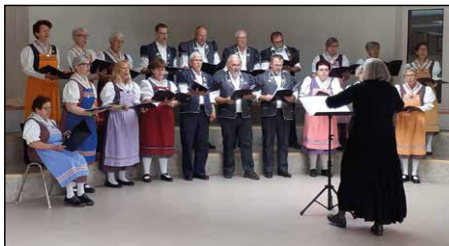
Chœur mixte St-Martin, tuttiCanti 2024

Le samedi 1 er juin 2024, le chœur mixte de St-Martin a participé à la fête cantonale de chant tuttiCanti à Wünnewil.