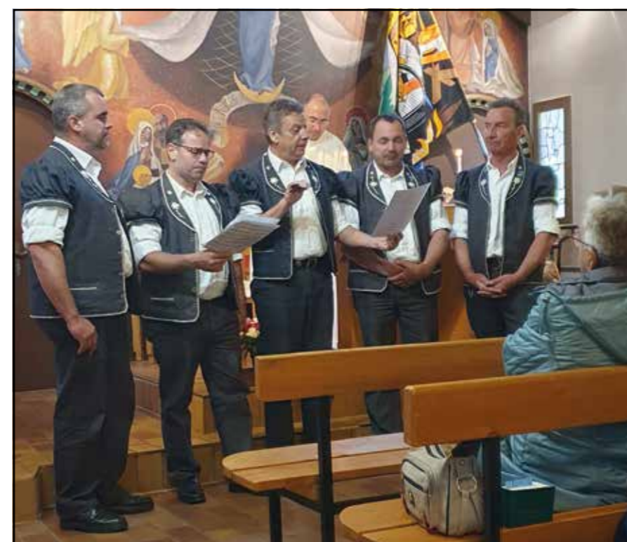
«Quatuor» des armaillis de la Veveyse