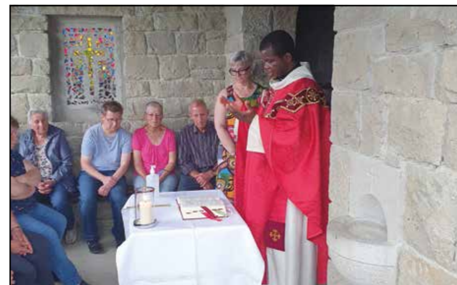
Chapelle du Jordil, 28.06.2024