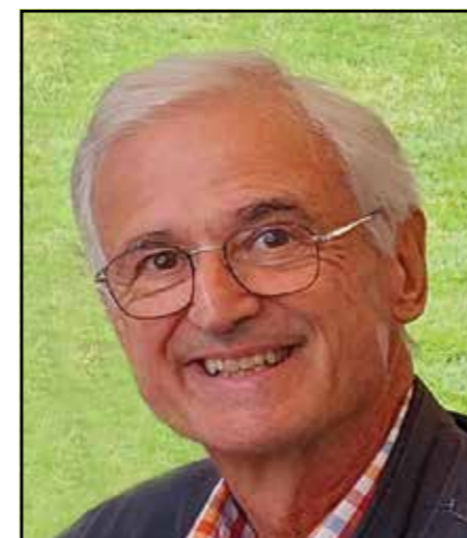
Texte FABIENNE TÂCHE

Nous sommes au regret de vous informer du décès de Pierre-Yves Barras