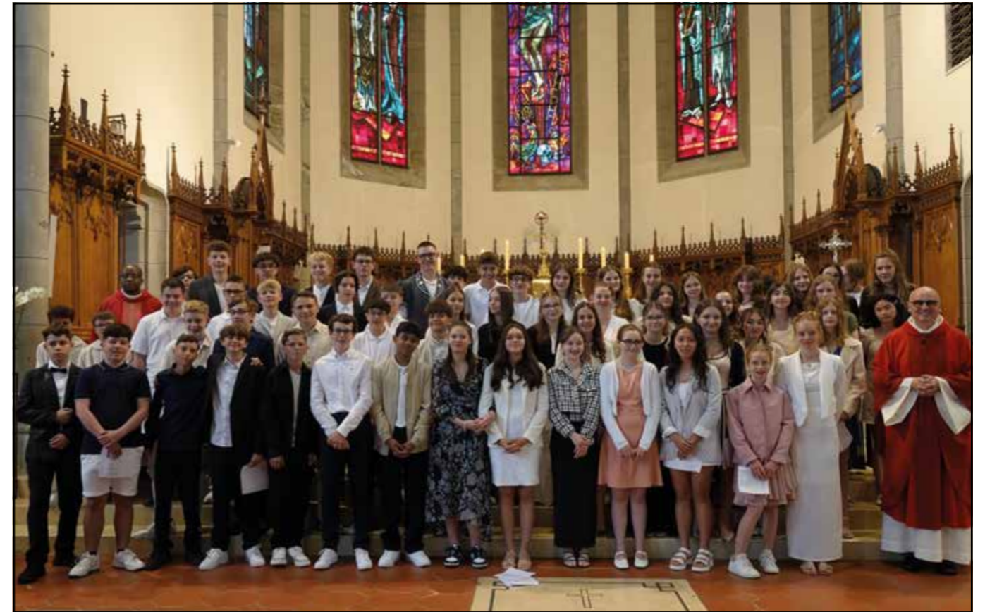
Châtel-St-Denis, le 16 juin 2024