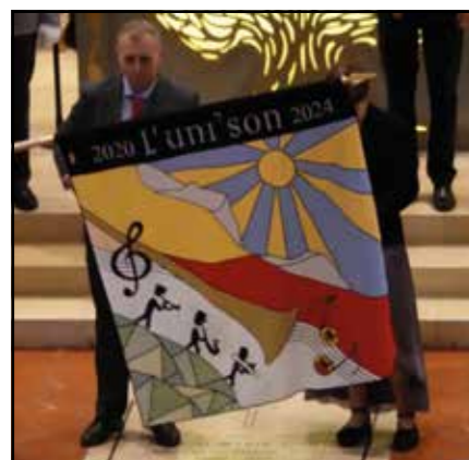
Bénédiction du drapeau et des nouveaux costumes