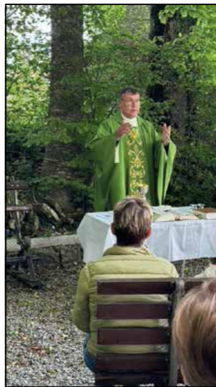
La nature, aussi un lieu pour célébrer.

Comme de coutume dans la paroisse de Le Crêt - Progens, chaque mardi soir du mois de mai une messe est célébrée à la grotte, dédiée à Notre-Dame du Crêt. En cas de mauvais temps, ces messes ont lieu à l'église. Cette année, la météo fut quelque peu capricieuse, et seulement deux messes sur quatre ont été célébrées dans ce joli coin de nature. C'est un moment privilégié, apaisant, où chaque participant bénéficie tantôt du chant des oiseaux, tantôt du ronflement d'une tondeuse à gazon au loin; mais pas de quoi troubler la prière qui est particulière du fait de la proximité du prêtre, des servants de messe occasionnellement, et des fidèles. Merci à toutes les personnes qui contribuent au maintien des lieux et de cette jolie tradition.